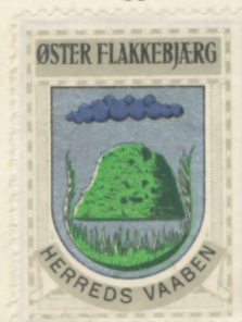
Øster Flakkebjerg Herred